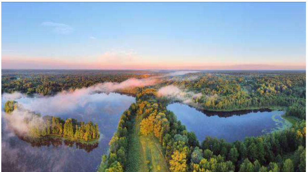
6. Вид озеро Ржавец и озеро Поганое.