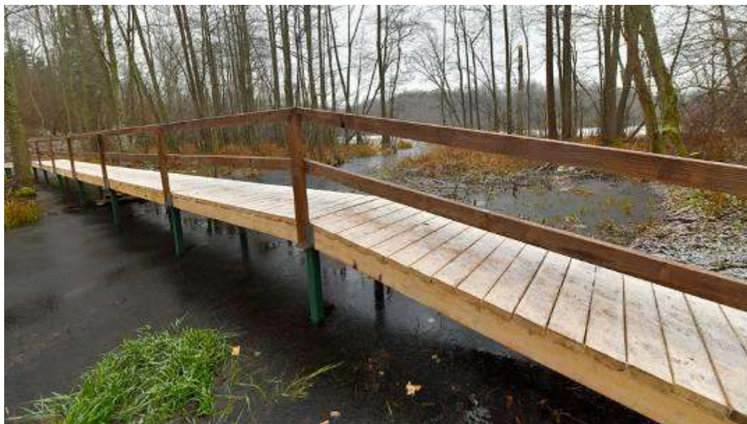
1. Мост через протоку.