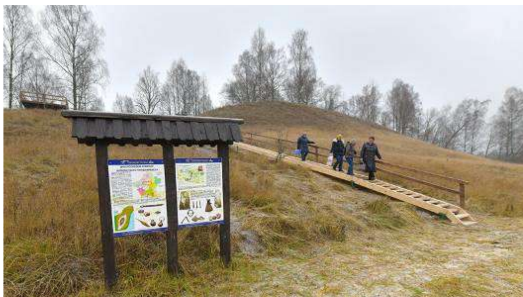
2. Информационный стенд у подножья городища Вержавск.