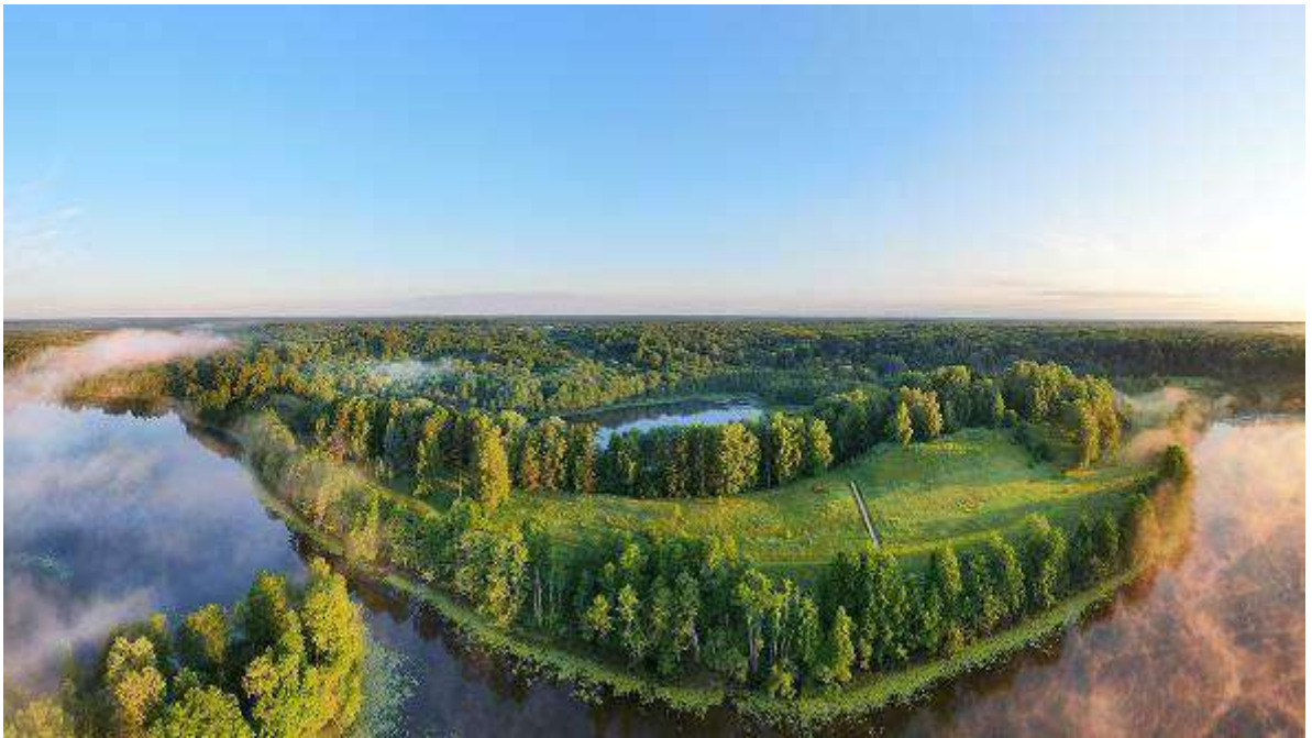
5. Вид на место городища Вержавск.