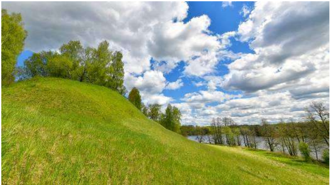
3. Место древнего городища Вержавск.