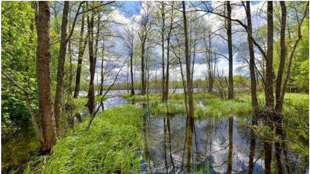
4. Протока с видом на озеро Ржавец.