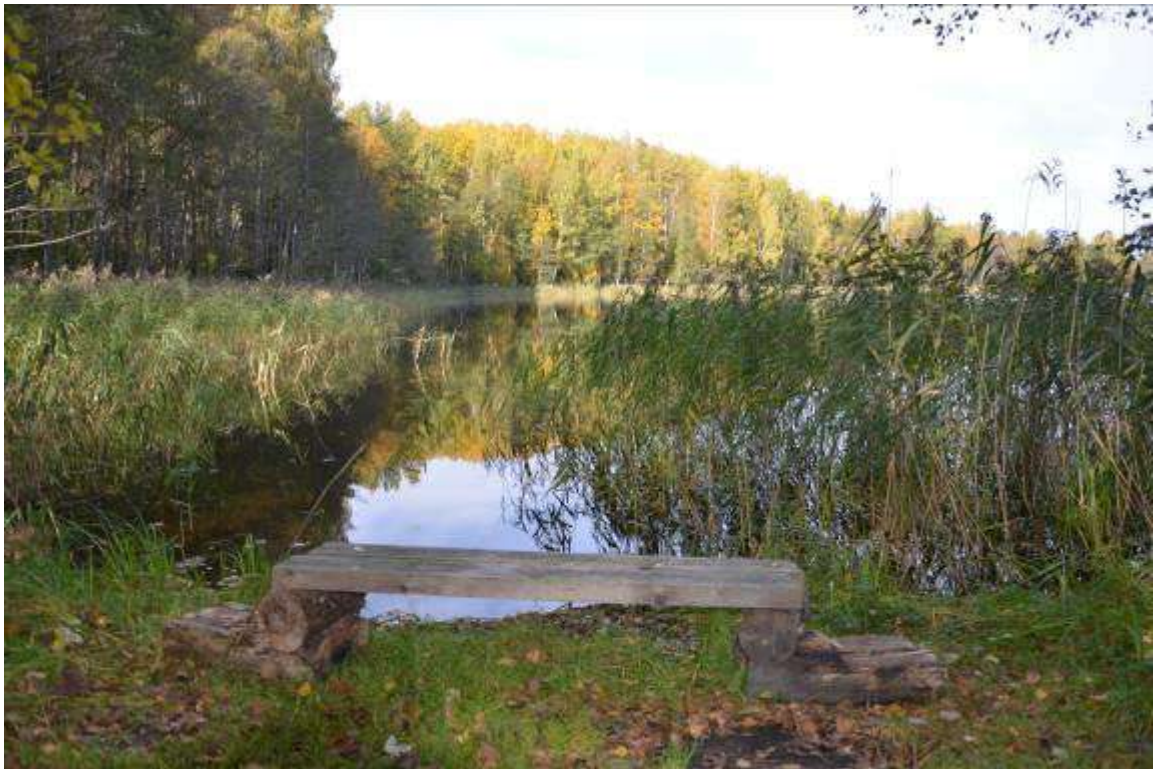
5. Вид на озеро Рытое.