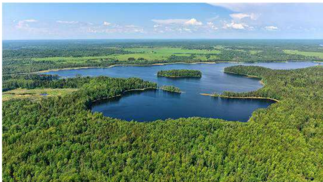
1. Озеро Рытое, лето.