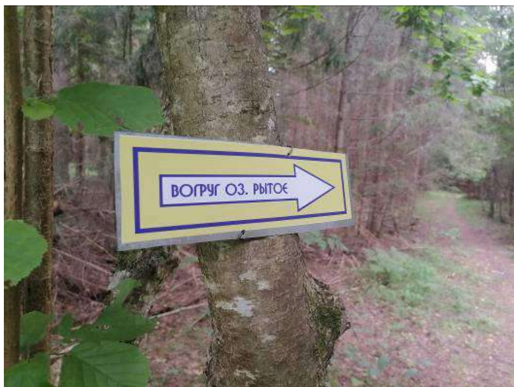
4. Указатель на маршруте.