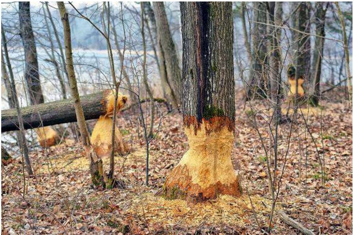
6. Погрызы бобра на маршруте.