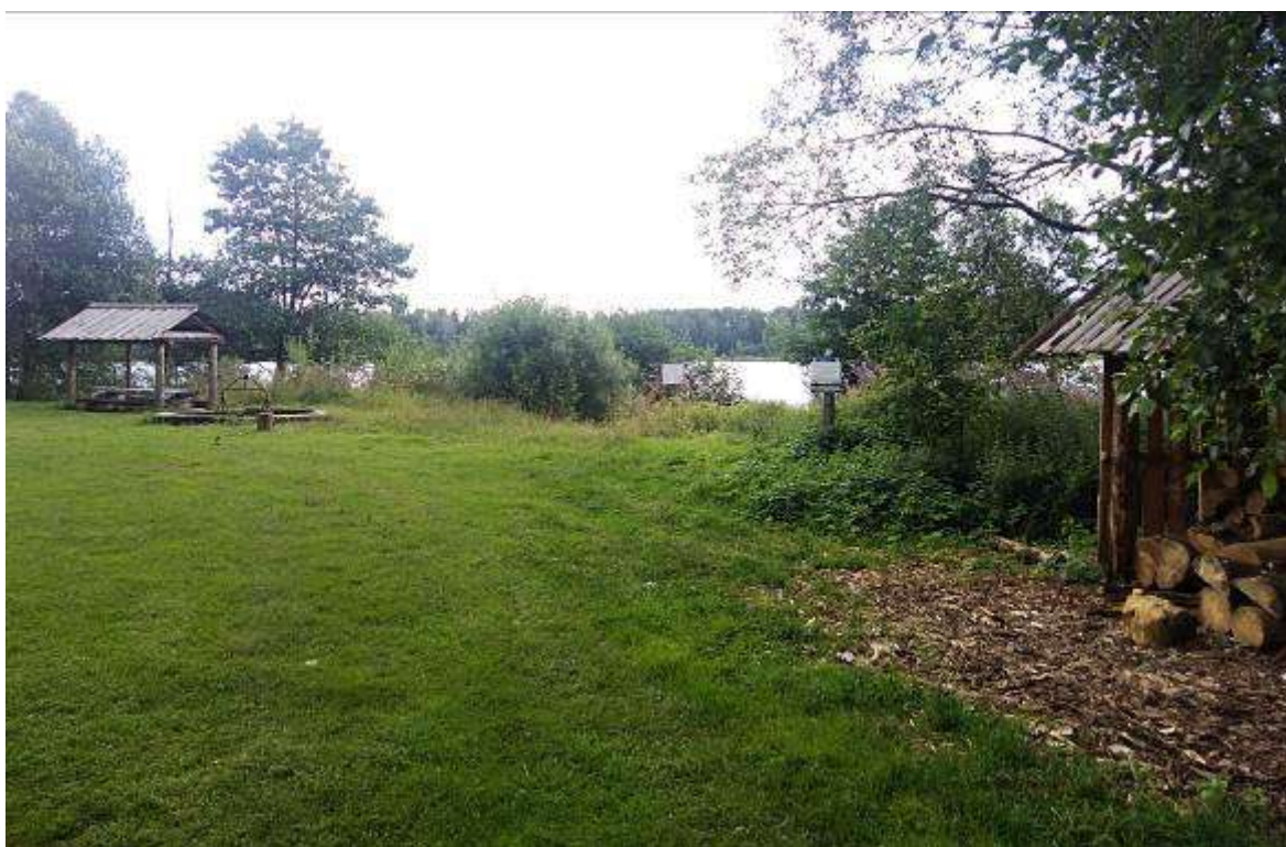
8. Турстоянка «Яблони».