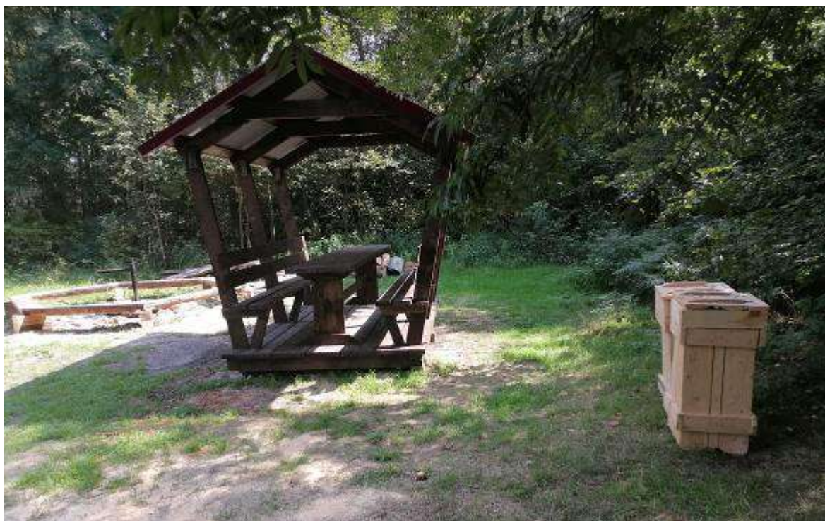
7. Место отдыха на турстоянке «Большая».