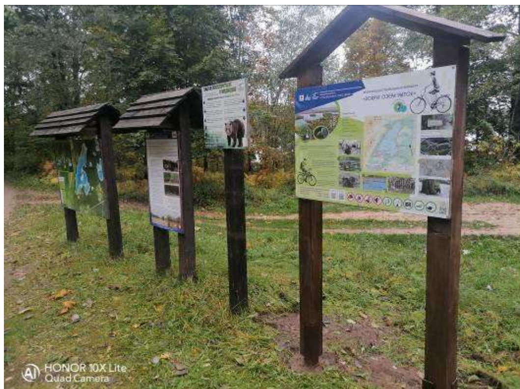
3. Информационные стенды на маршруте.