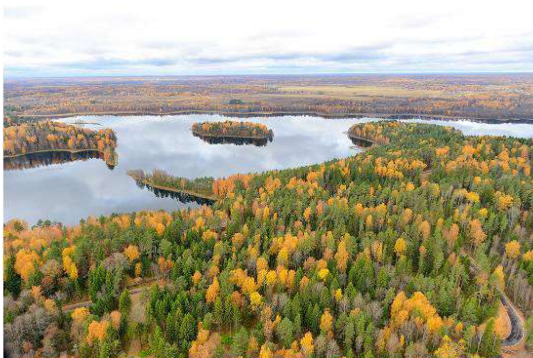
2. Озеро Рытое, осень.