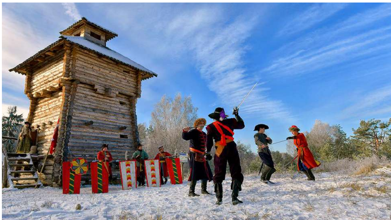
2. Сторожевые башни.