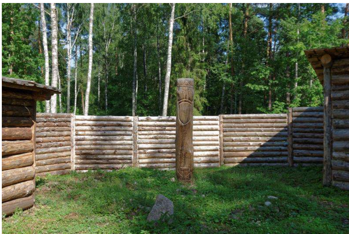
6. Реконструкция городища.