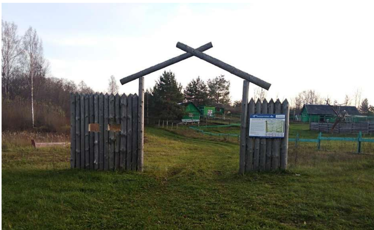
3. Входная группа. Автор фото О. Г. Солар