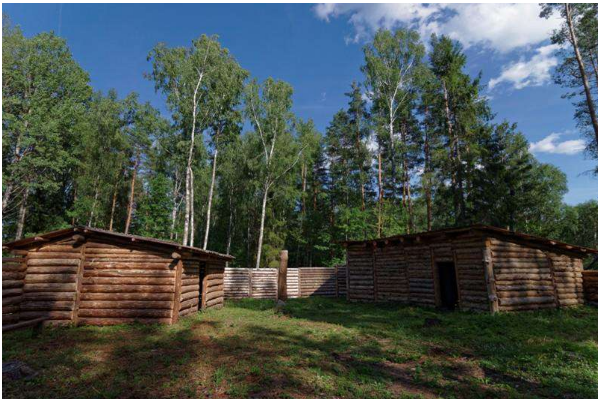
5. Реконструкция городища.