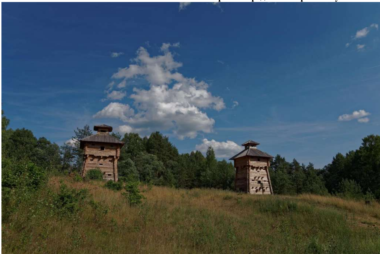
1. Сторожевые башни.