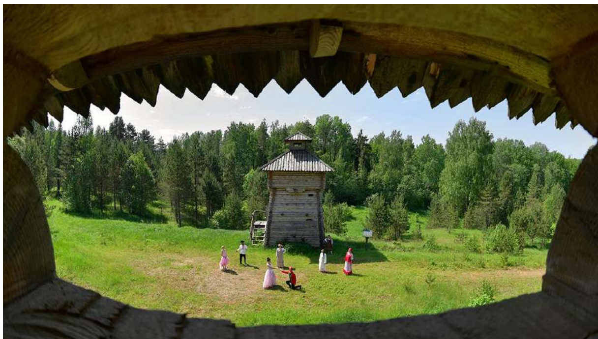
4. Вид из сторожевой башни.