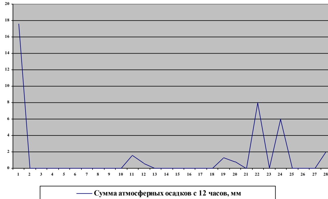
Средняя сумма атмосферных осадков с 12 часов за февраль 2015 года, мм

Самый ветреный день 1 февраля, ветер достигал 15,3 км/ч (4,2 м/с), самый высокий порыв ветра, так же 1 февраля, достиг 14 м/с. Средняя скорость ветра по данным метеостанции за февраль месяц составляет 7,6 км/ч (2,0 м/с).